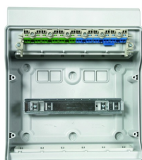
Bornier intégré pour raccordement des conducteurs PE et N.