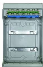
Bornier intégré pour raccordement des conducteurs PE et N.